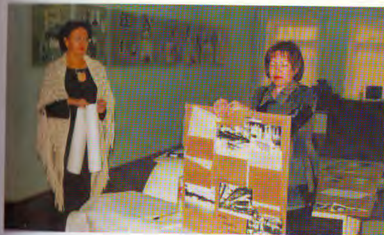
Подготовка к открытию выставки «Воркута-Ленинград» в Национальном музее Коми.